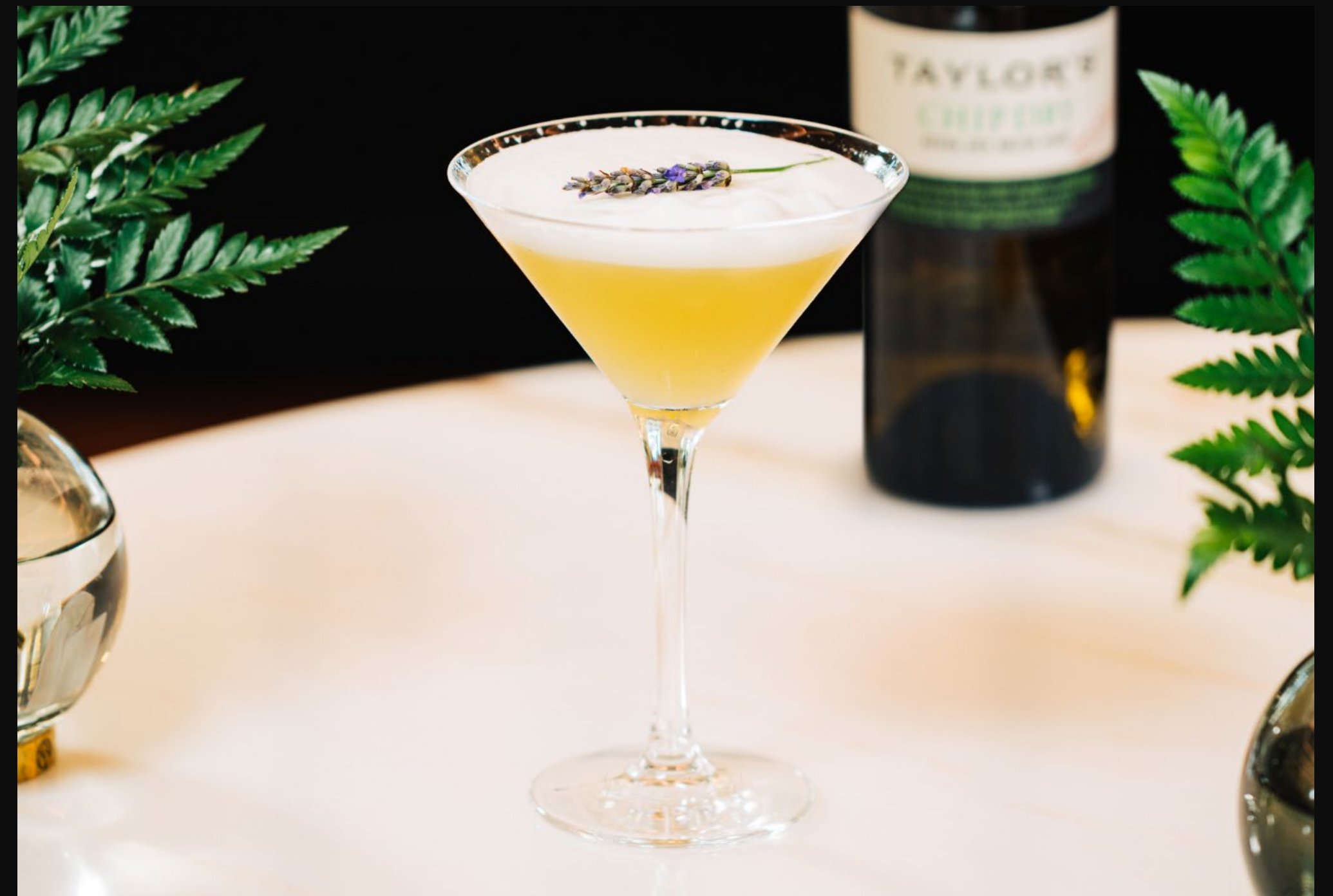
The Kingsman Cocktail by Taylor's